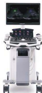
NOWOŚĆ VINNO ULTIMUS 9E