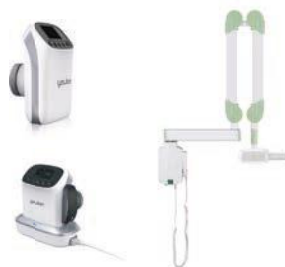
NOWOŚĆ Wall Mount DR