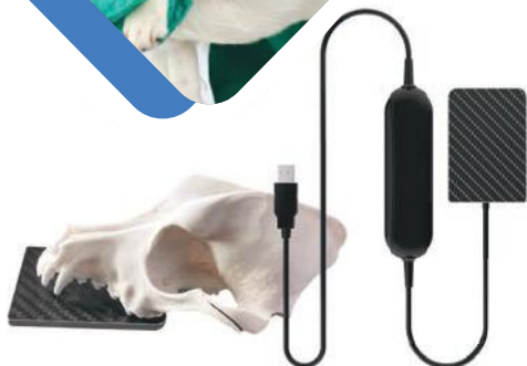
NOWOŚĆ SENSOR NR 4