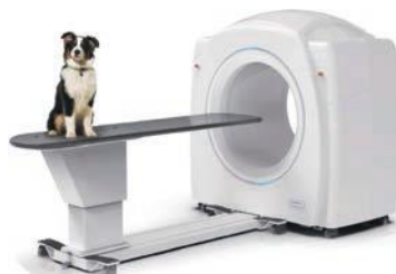
NOWOŚĆ CBCT TOMOGRAF