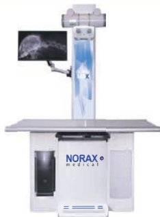
NOWOŚĆ X-WET MAXI